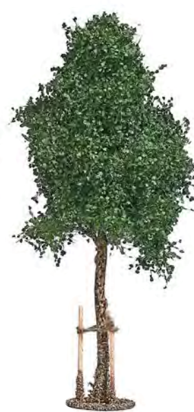
10626 Junge Platane mit Baumstützen NEU

Young birch with stakes. Jeune bouleau avec tuteurs.