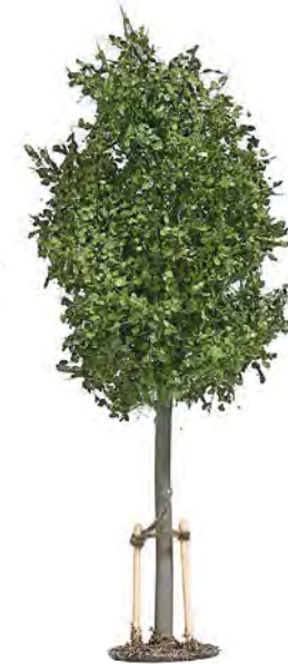
10627 Junge Linde mit Baumstützen NEU

Young sycamore with stakes. Jeune platane avec tuteurs.