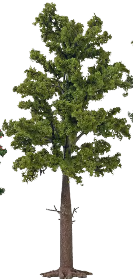
10620 Laubbaum maigrün