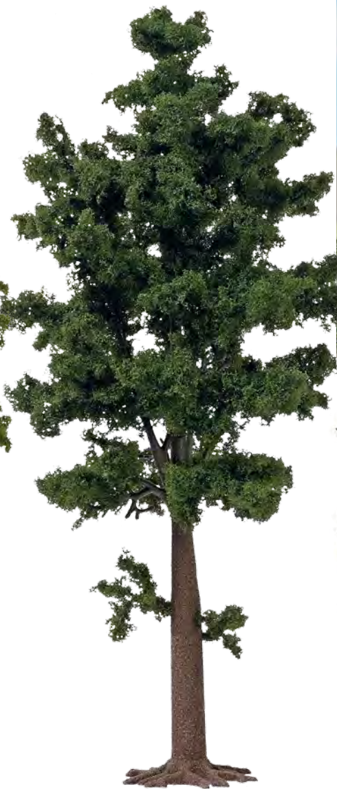
10621 Laubbaum dunkelgrün

Deciduous tree, spring green. Arbre feuillu, vert printanier.