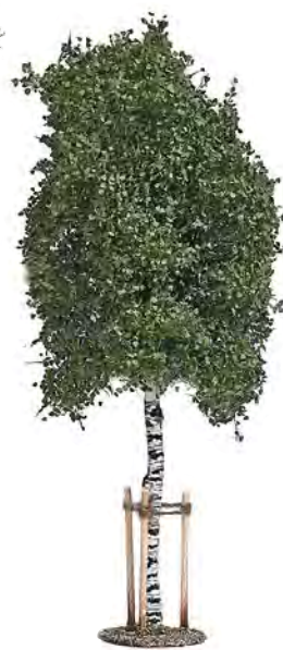
10625 Junge Birke mit Baumstützen NEU

Deciduous tree, dark green. Arbre feuillu, vert foncé.