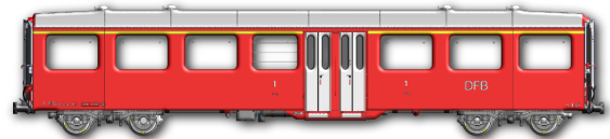
Modell A 4167 | Art. MKMOD 200 100 Modell A 4163 | Art. MKMOD 200 101