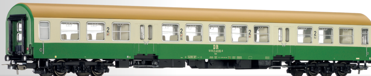
Abb. zeigt Art. 74979

Reisezugwagen 2. Klasse Bmh, Bauart Halberstadt, der DR, 2. Betriebsnummer 2nd class passenger coach Bmh, type Halberstadt, of the DR, 2nd operation number