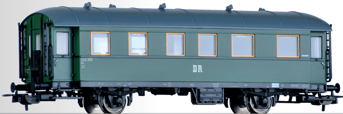
Personenwagen 2. Klasse Bip der DR, 2. Betriebsnummer 2nd class passenger coach Bip of the DR, 2nd operation number