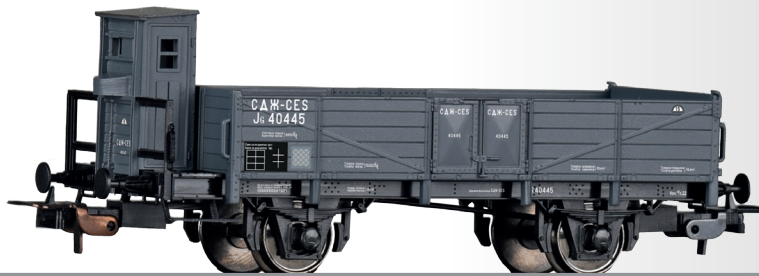
Offener Güterwagen JG der CES Open car JG of the CES