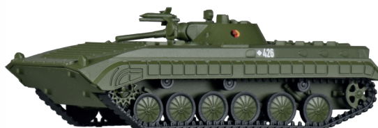
Schützenpanzer BMP-1 „NVA“ Tank type BMP-1 „NVA“