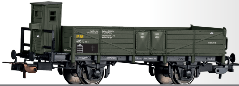
Offener Güterwagen Omk der Süddeutschen Eisenbahn-Gesellschaft Open car Omk of the Süddeutschen Eisenbahn-Gesellschaft