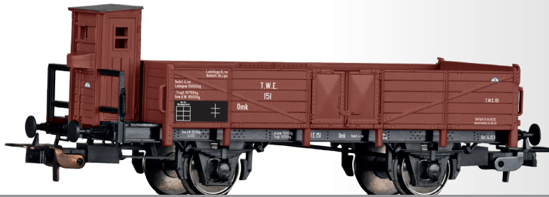
Offener Güterwagen Omk der Teutoburger Wald Eisenbahn (TWE) Open car Omk of the Teutoburger Wald Eisenbahn (TWE)