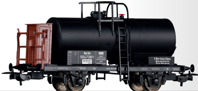
Kesselwagen „H. Wertheim Söhne“, eingestellt bei der K.P.E.V. Tank car “H. Wertheim Söhne” of the K.P.E.V.