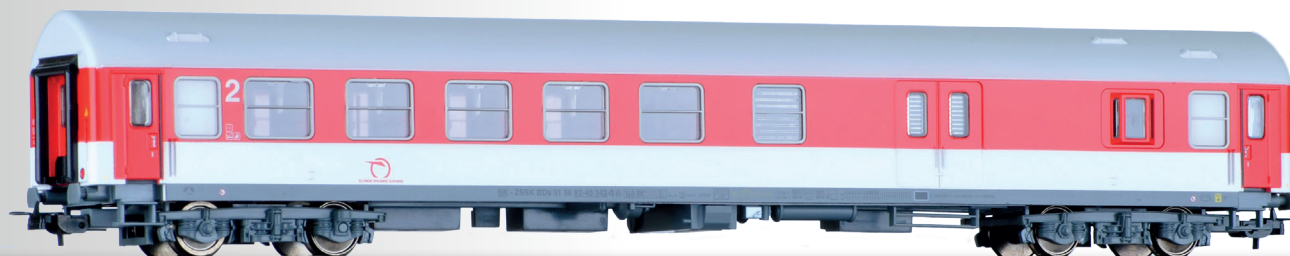
Abbildung zeigt 74821