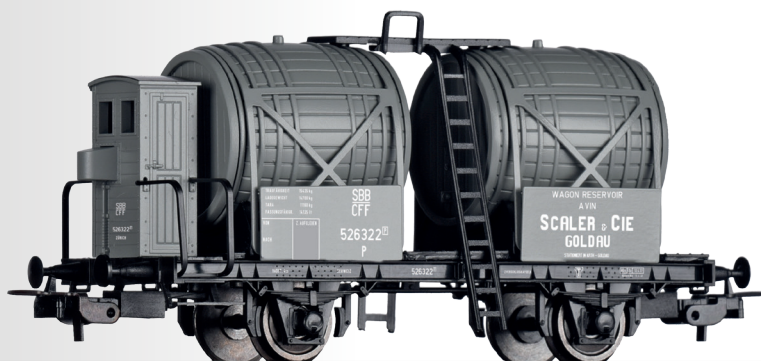
Weinfasswagen „Scaler & Cie.“, eingestellt bei den SBB Wine barrel car “Scaler & Cie.” of the SBB