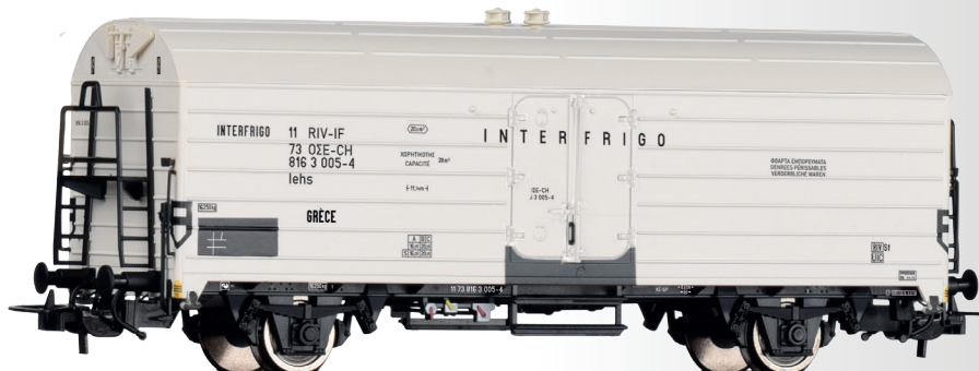
Kühlwagen lehs „Interfrigo“ der OSE Refrigerator car lehs „Interfrigo“ of the OSE