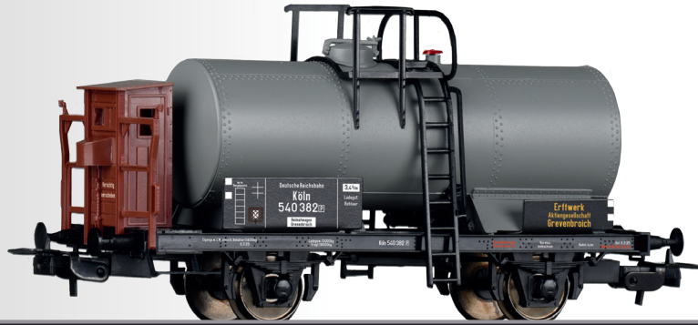
Kesselwagen „Erfwerk Aktiengesellschaft Grevenbroich“, eingestellt bei der DRG Tank car "Erfwerk Aktiengesellschaft Grevenbroich" of the DRG