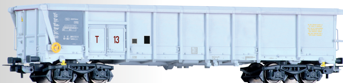
Rolldachwagen Tamns der SNCF Sliding roof car Tamns of the SNCF