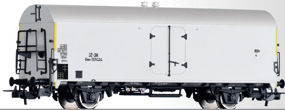
Kühlwagen Gmv der JZ Refrigerator car Gmv of the JZ